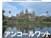
アンコールワット