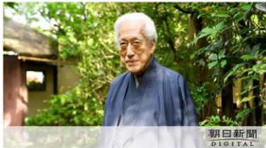
千玄室師曰く 芸とは ○身に着けた技 ○技能 ○学問